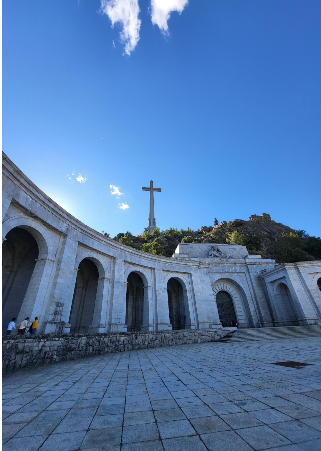
Katedra wykuta w skale oraz krzyż w Dolinie Poległych