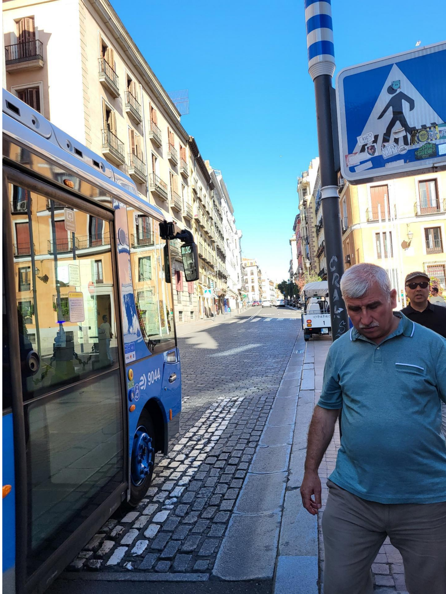
Spacer po Madrycie z hiszpańskimi kolegami oraz większość referatów