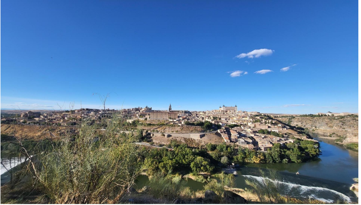
Toledo w całej swojej pięknej okazałości