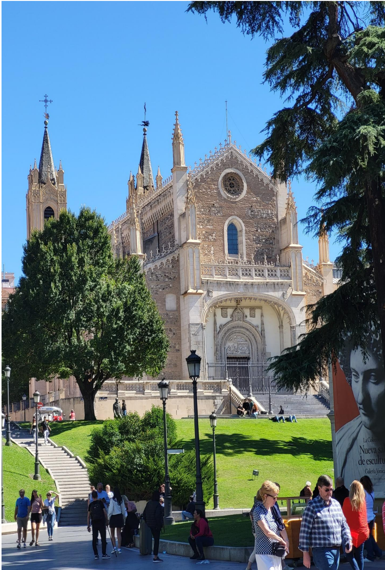
Widoki przed wejściem do Muzeum Prado