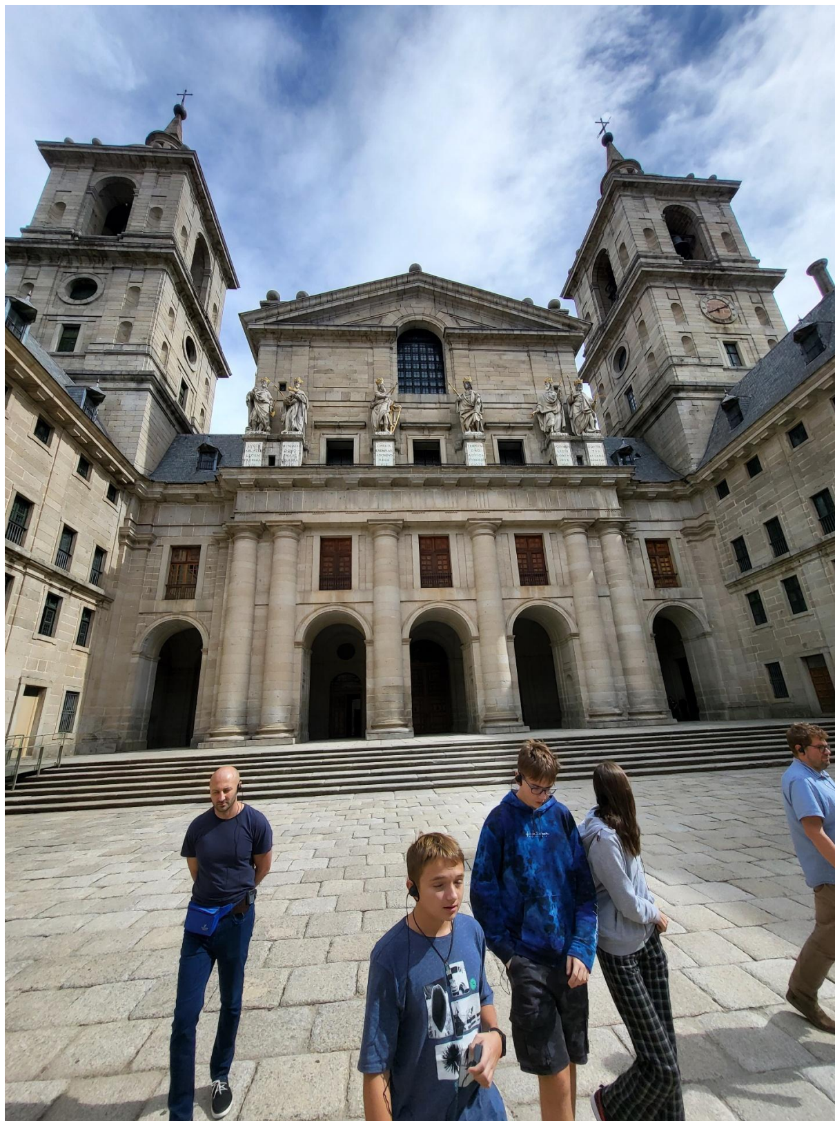
Wejście do katedry w pałacu Escorial