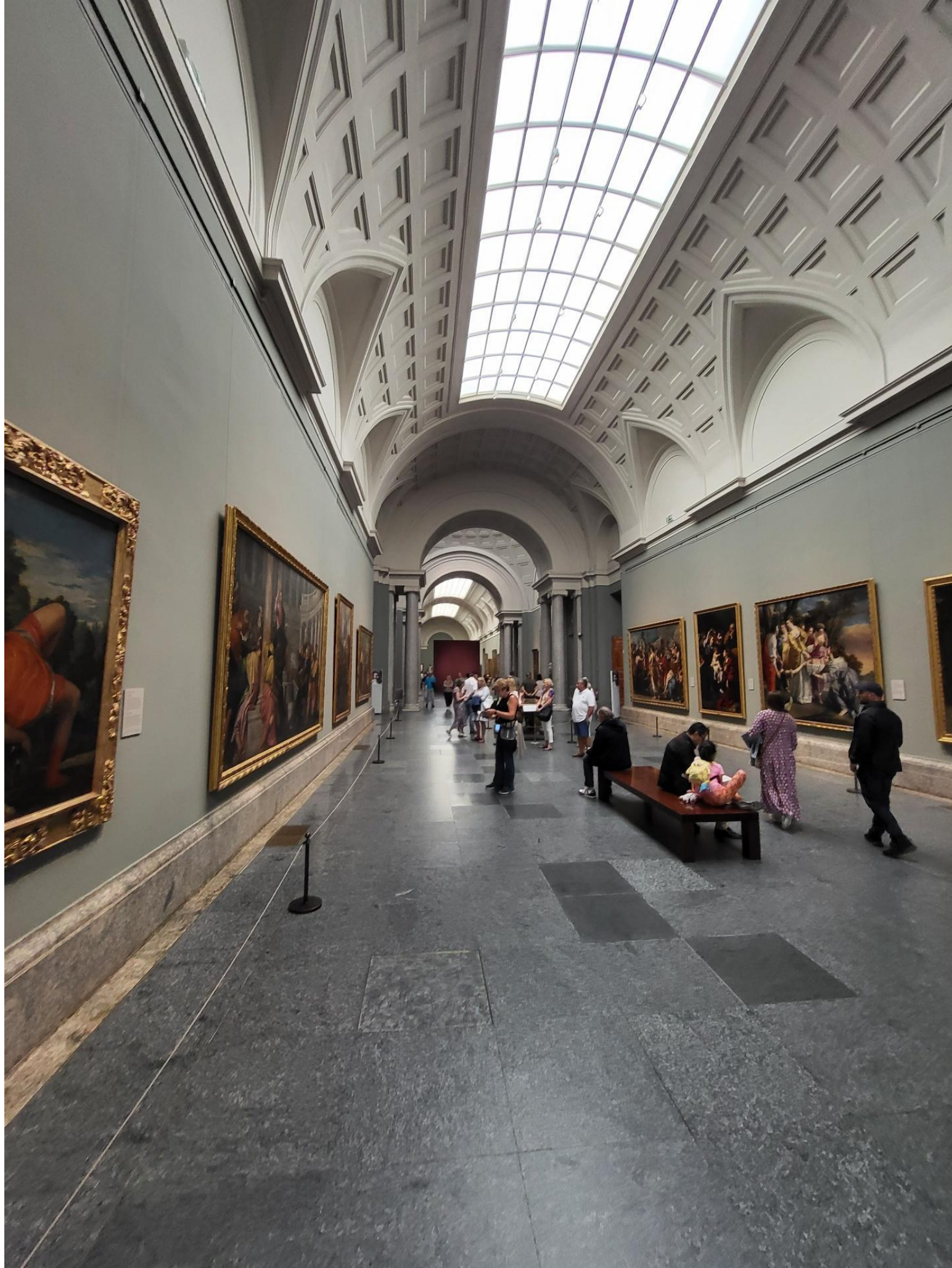
Zdjęcie wnętrza Muzeum Prado