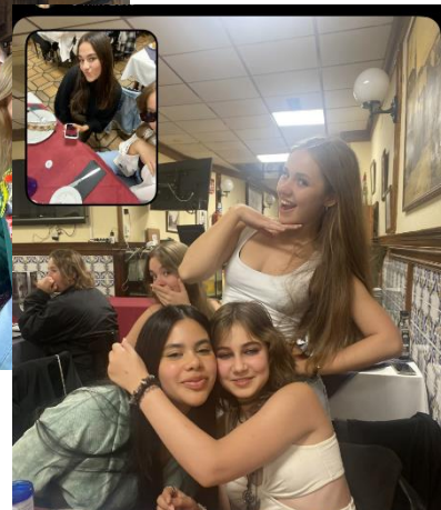
Park Buen Retiro

DZIEŃ 3- Zwiedzane Pałacu Escorial i Mauzoleum Valle de los Caidos.