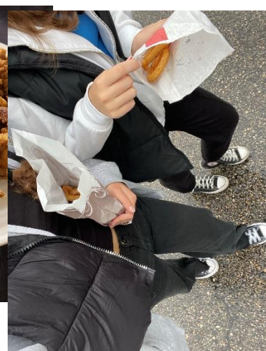
Kalmary oraz churrosy