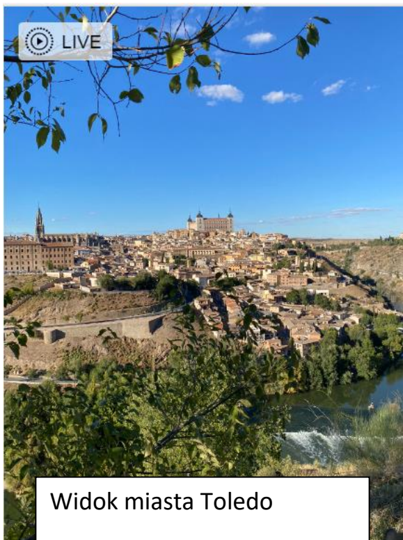
Widok miasta Toledo

DZIEŃ 5 -Ostatniego dnia pojechalismy do Toledo, zwiedzilismy Alcazar i Katedre.