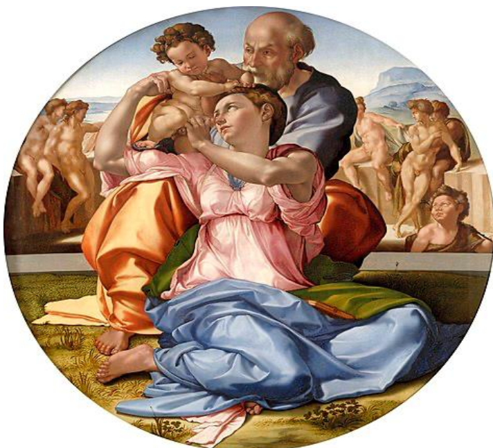
Michał Anioł, Święta Rodzina z małym św. Janem , 1503–1504, 1200 mm

Obraz został umieszczony w ramie tondo i przedstawia Rodzinę Świętą w momencie chrztu małego Jezusa. Widzimy, że mały Jezus jest podawany przez św. Józefa na ręce Matki Bożej. Potwierdzeniem tego jest fakt, że dziecko wychyla się w stronę matki, a jego stópka wspiera się na jej ramieniu. Możemy przyjąć, iż św. Józef jest personifikacją samego Boga, co potwierdza nam podobieństwo św. Józefa do starca podtrzymującego ciało w innym dziele Michała Anioła pt. Złożenie do grobu , które nawiązuje do ikonografii Pietas Patris. W tle za głównym planem widzimy wiele osób - są to najprawdopodobniej neofici, którzy przygotowują się do chrztu. Po prawej stronie możemy dostrzec małego Jana Chrzciciela, który spogląda na małego Jezusa. Nagie postacie mają nawiązywać do kultury pogańskiej. Są oddzielone od Jezusa murem, który ma symbolizować oddzielenie świata pogańskiego od kultury chrześcijańskiej.