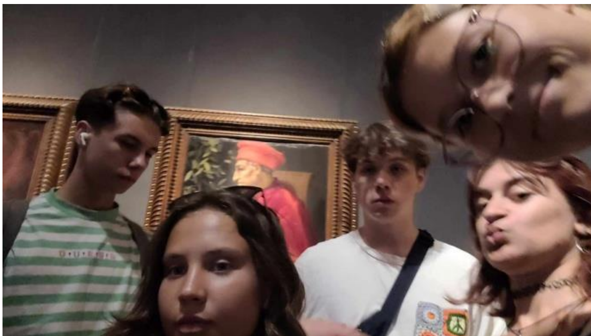
Portret Cosimo Starszego

Jest to obraz olejny stworzony przez włoskiego artystę barokowego Caravaggia na początku XVII wieku. Stanowi on interpretację innego obrazu. Ta kopia jest lekko ulepszona i udoskonalona.