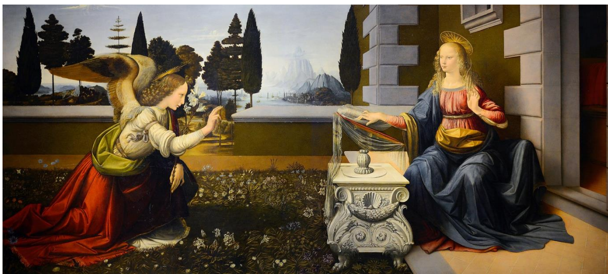
Leonardo da Vinci Zwiastowanie , 1472, 2170 x 980 mm

Obraz ten jest pierwszym obrazem Leonarda da Vinci, przedstawia spotkanie Maryi z Archaniołem Gabrielem. Widzimy, iż Archanioł unosi rękę w geście pozdrowienia, jak i przekazania ważnej informacji. W tym miejscu warto zwrócić uwagę na białą lilię w ręku Anioła - symbol Niepokalanego Poczęcia Maryi. Matka Boża odpowiada, również unosząc rękę w celu powitania posłańca. Ogród, w którym rozgrywa się akcja, jest symbolem dziewictwa Maryi, a pulpit, na którym Matka Boża trzyma rękę, symbolizuje jej mądrość.