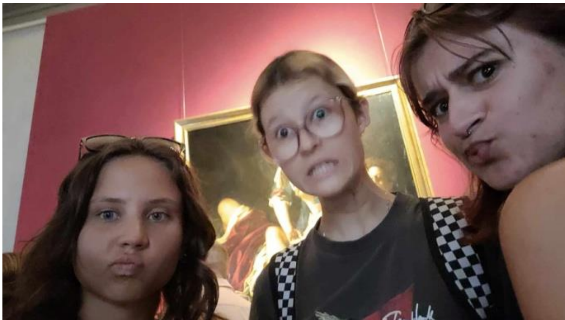
Judyta zabijająca Holoforesę

Jest to obraz olejny stworzony przez włoskiego artystę barokowego Caravaggia na początku XVII wieku. Stanowi on interpretację innego obrazu. Ta kopia jest lekko ulepszona i udoskonalona.