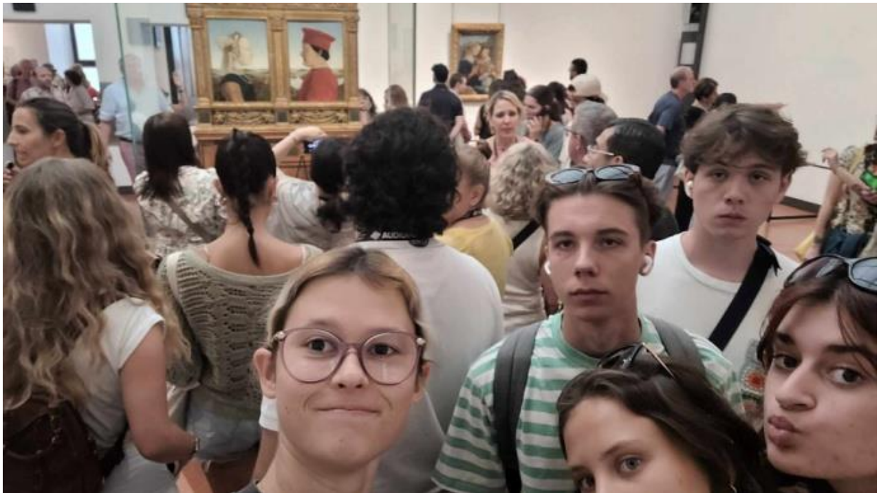
Piero della Francesca

„Portret Federica de Montefeltro i jego żony Battisty Sforzy”