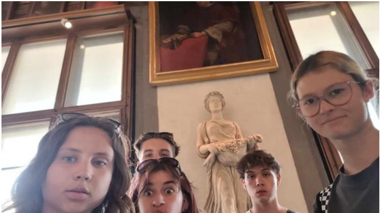
Portret Leona X

Na obrazie, który został namalowany w 1518 roku przez Rafaela Santi, widzimy papieża Leona X. Siedzi on przy stole w białym ubraniu z czerwonymi akcentami. Stół jest przykryty czerwonym sukniem.